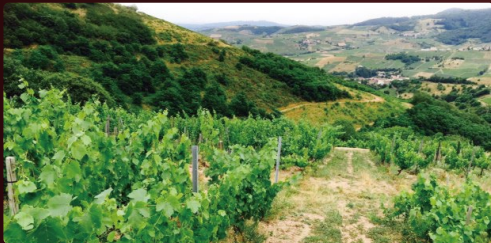
有機栽培を実施しているマドヌの自社畑